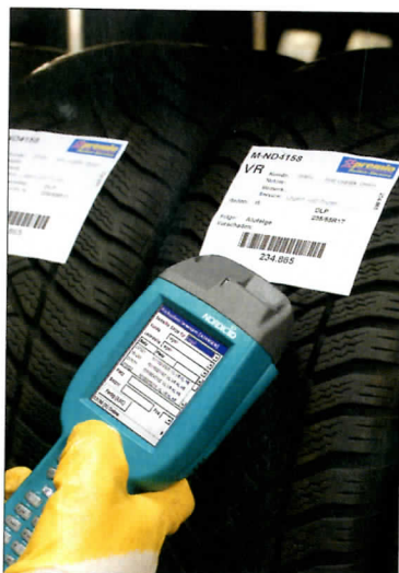
Bei Premio in München werden alle Arbeitsschritte eingescannt.

Das Unternehmen bewahrt über 25.000 Kunden-